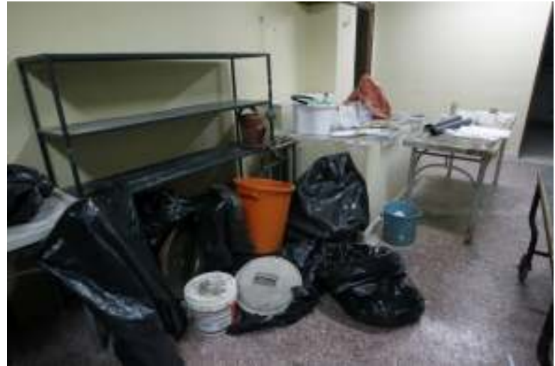
Ο χώρος εργασίας και ο εξοπλισμός...