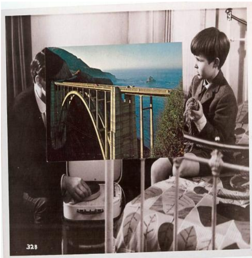
John Stezaker, Bridge (B) I, 2007