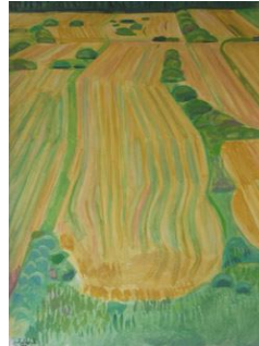
Τοπία Ρόδου, 1974